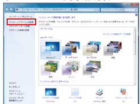
図3 こちらはWindows 7の「個人設定」画面。右側の表示はVistaとは異なるものの、左ペインから「デスクトップアイコンの変更」を選んだ後の設定方法は同じだ