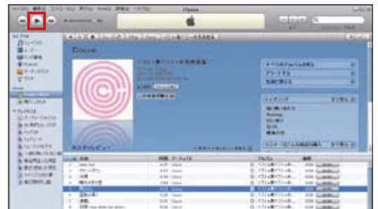
図2 聞きたいアルバムを見つけたら、下に表示されている収録曲の中から聞きたい曲を選択。iTunesの画面左上にある「再生」ボタンを押せば、30秒の試聴ができる